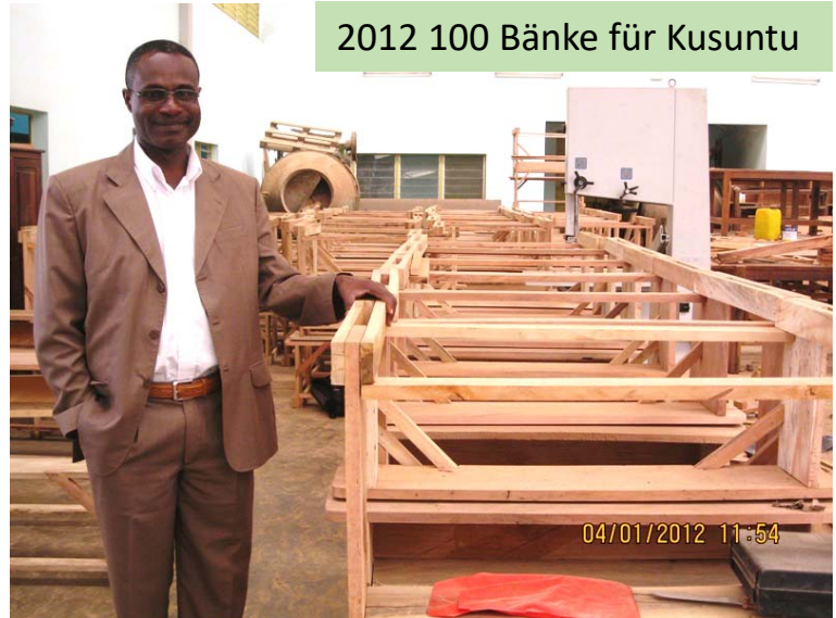
2012 100 Bänke für Kusuntu

Ende 2015 haben wir die Realschule Novissi besucht und dort unglaubliche Zustände erlebt. Insgesamt besuchen die Schule in 11 Klassen mehr als 1.000 Schüler. Das heißt im Schnitt ca. 100, in der größten Klasse unglaubliche 118 Schüler. Die Kinder sitzen zu dritt und zu viert in Zweierbänken.