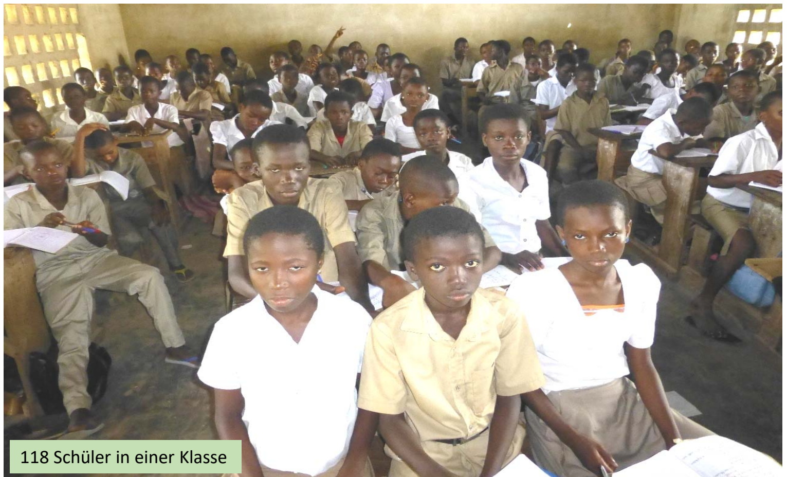
118 Schüler in einer Klasse

Diese Schule besuchen inzwischen auch 30 unserer Patenkinder. Durch eine beispielhafte Spendeninitiative zweier Paten konnten wir für die Schule die Spende von 100 neuen Schulbänken realisieren. Wir hätten noch mehr Bänke gestiftet, um diesem Notstand abzuhelpfen. Aber mehr Bänke passen einfach in keine Klasse.