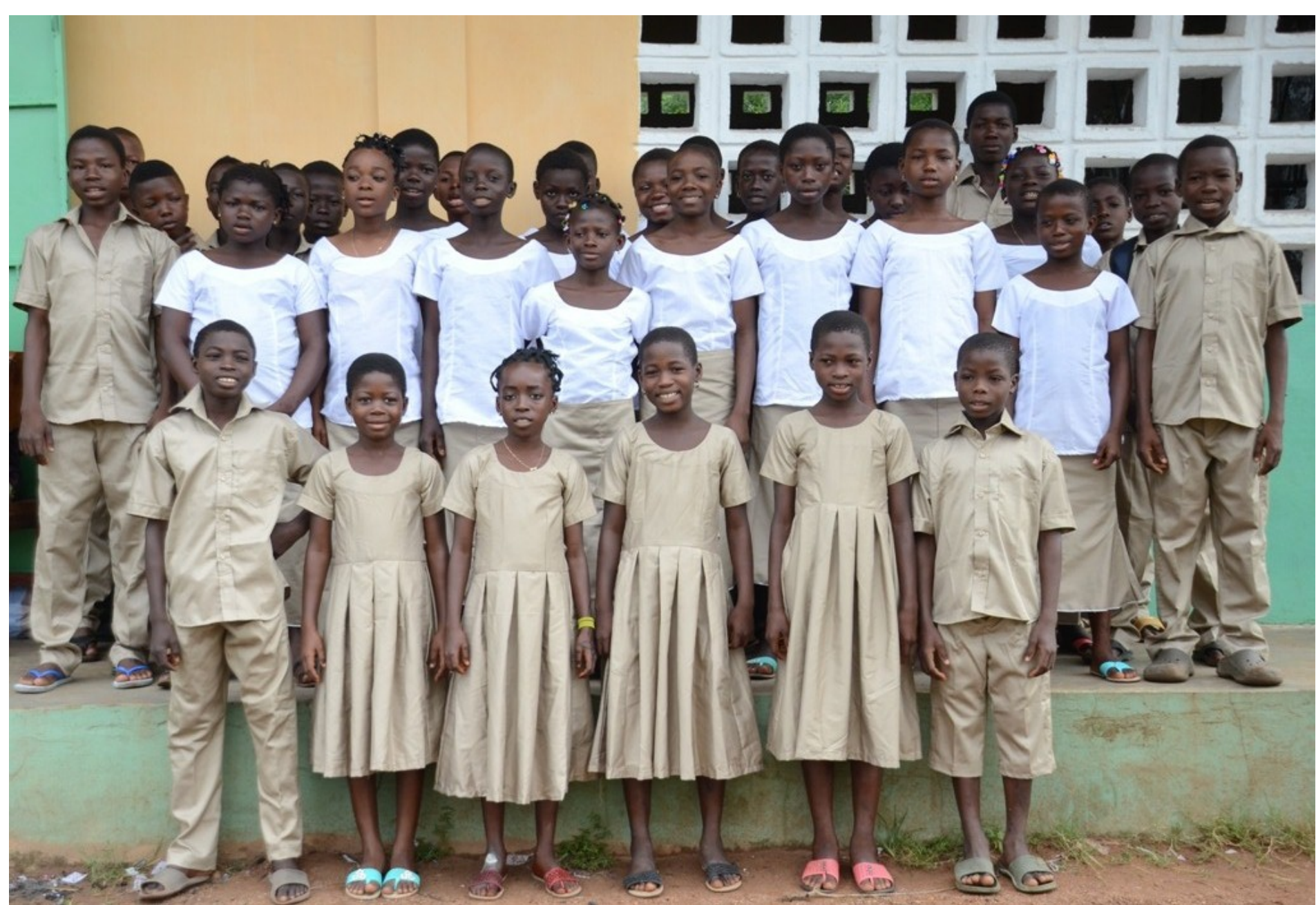
Unsere Patenkindergruppe in Novissi stolz mit neuen Kleidern. Die weißen Blusen sind das Erkennungszeichen der Realschülerinnen.