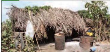
Wir schaffen eine Zukunftschance

Dazu durch zwei hauptamtliche Projektleiter vor Ort (Oberschullehrer) gezielten Zusatzunterricht sowie soziale Betreuung der Kinder und Familien.