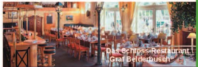
Das Schloss Restaurant „Graf Belderbusch“