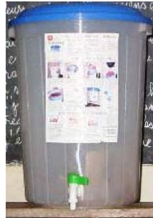
Frau Namou, (eine Patenmutter), erläutert die Untersuchungsergebnisse und zeigt den Wasserfilter