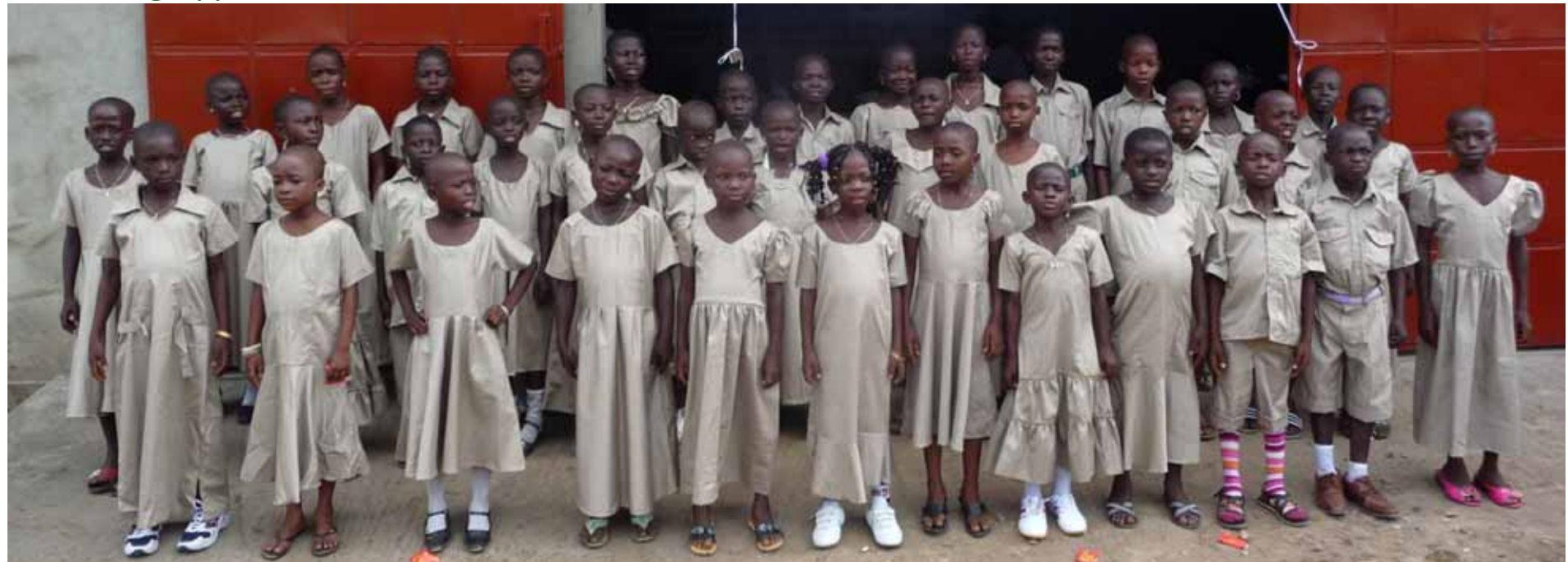
Und hier die Patengruppe in Novissi.