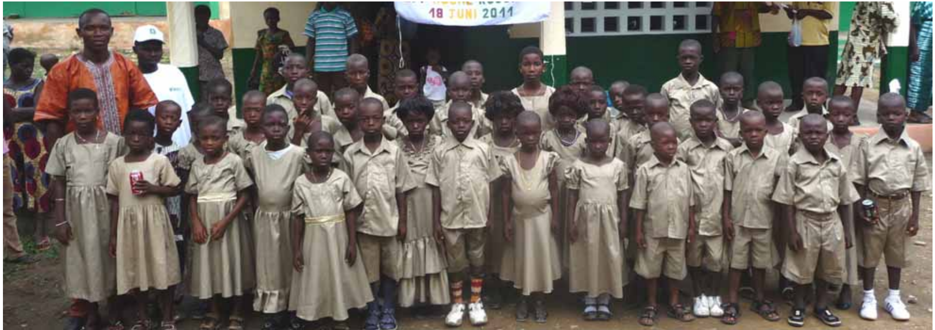
Die Patengruppe Kusuntu in neuen Kleidern.

Neue Schuluniformen für alle Kinder zum Schuljahresbeginn. Eine zweite Uniform finanzieren wir zur Schuljahreshalbzeit aus Spendengeldern.