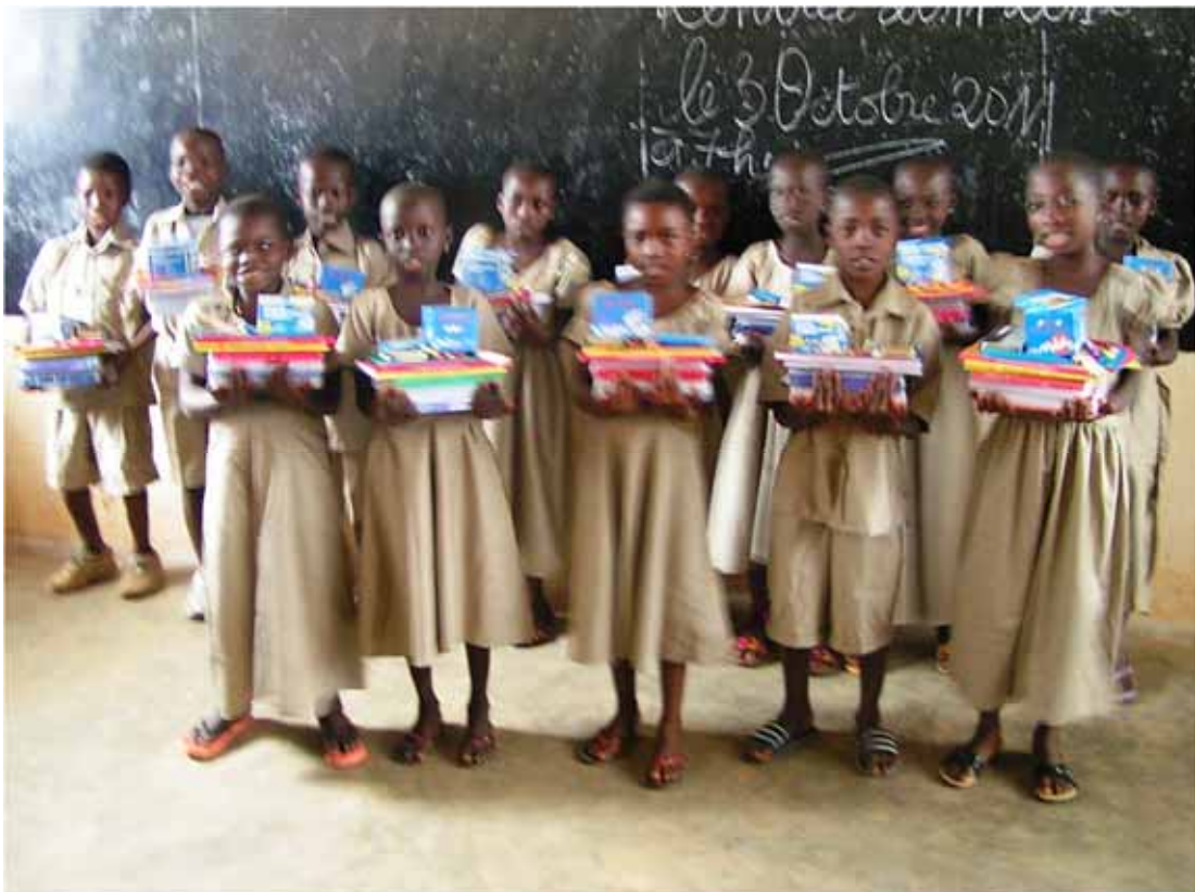
Die Patenkinder 4. Klasse und 5. Klasse der Grundschule Novissi mit ihrem Schulmaterial