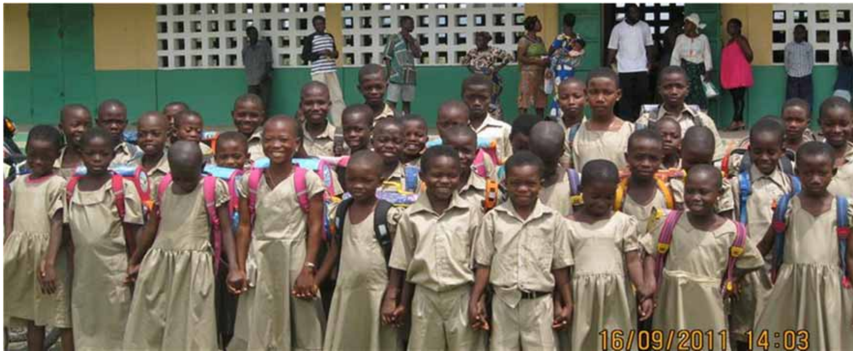
Gruppenfoto unserer Patenkinder in Kusuntu am letzten Tag des 10 Wochen Sommerseminars vor der Ausgabe des Schulmaterials fürs nächst Schuljahr