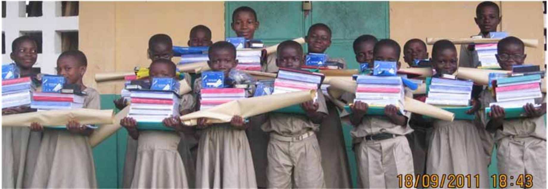
Patenkinder 4. Grundschulklasse in Kusuntu