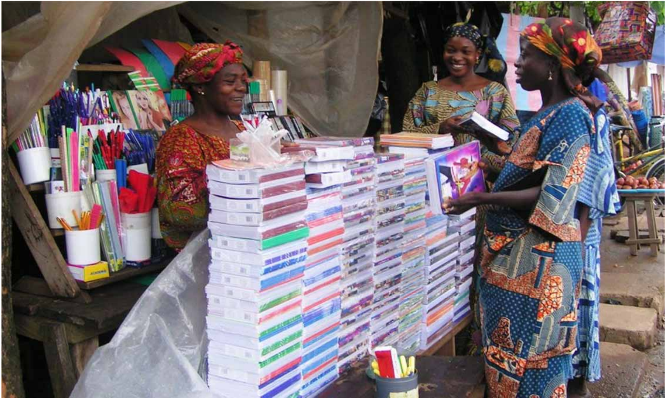
Einkauf des Schulmaterials für die Patenkinder in Novissi