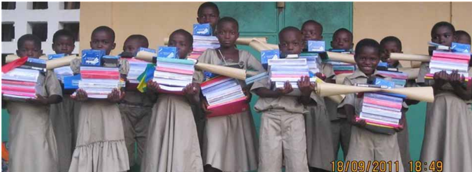
Patenkinder 5. Grundschulklasse in Kusuntu