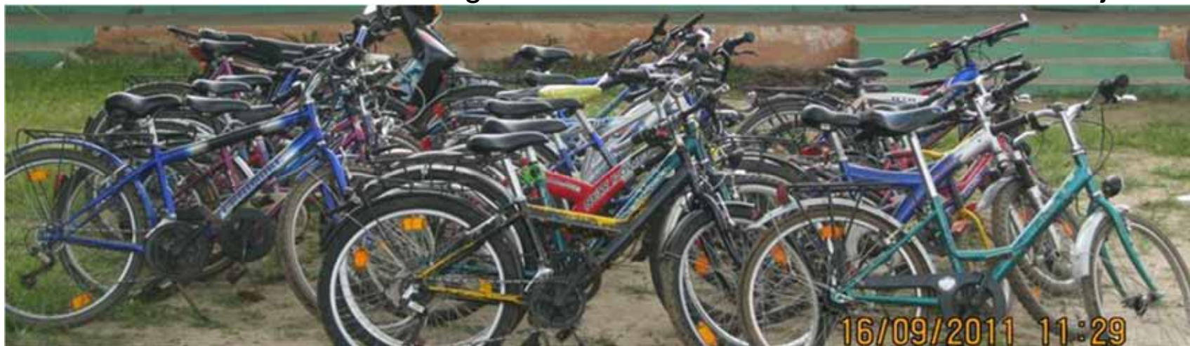
Der Parkplatz unserer Patenkinder am letzten Seminartag. Alle Räder sind in Schuss und es gibt keine Verkehrsunfälle