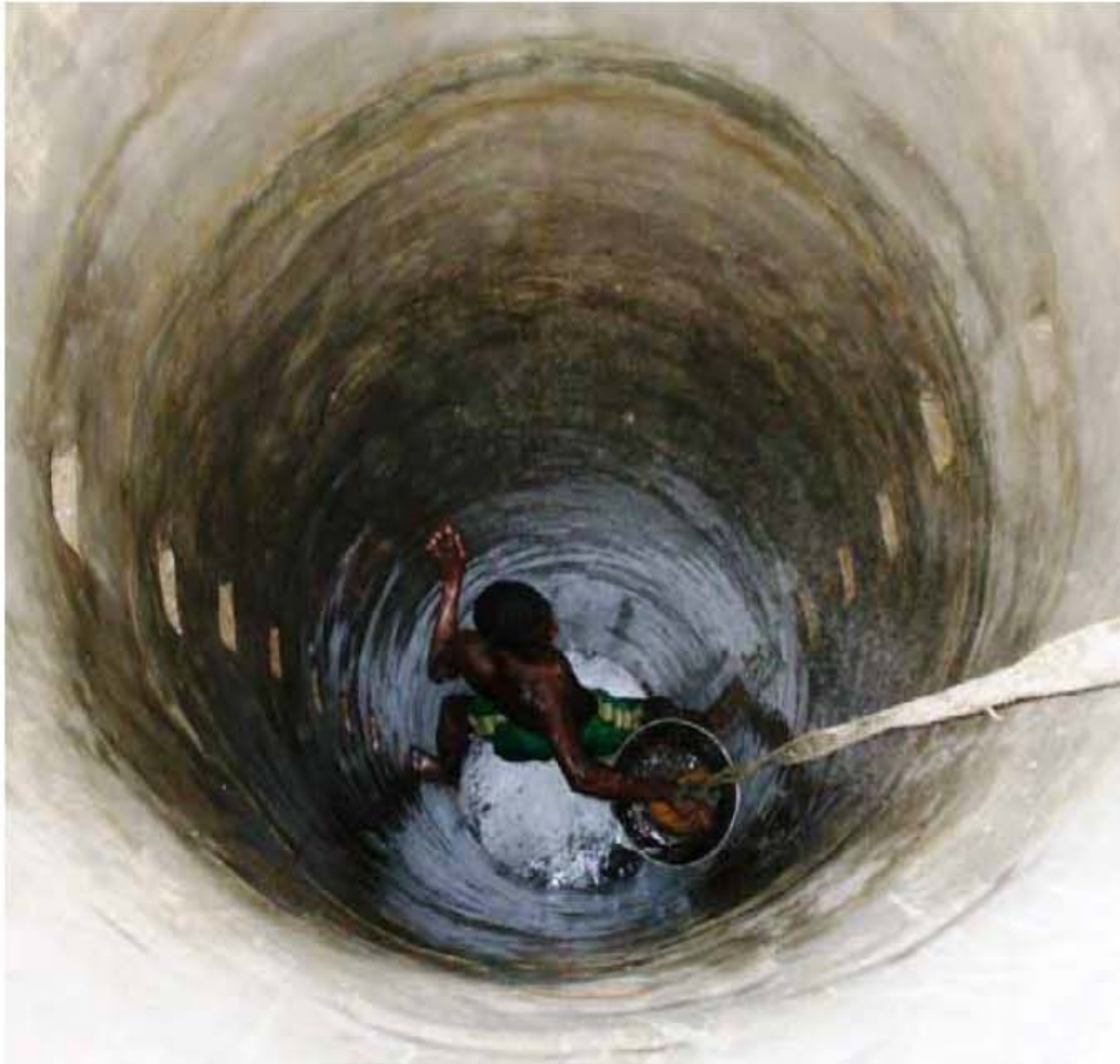
Bisher Bau von 3 Brunnen mit einer Bautiefe von bis zu 15 m