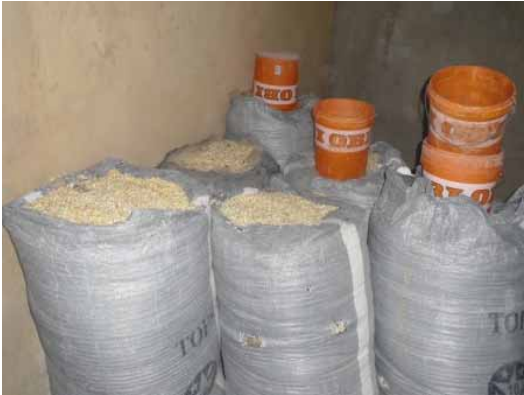
2.500 kg Maiskörner. Das Hauptnahrungsmittel in Togo