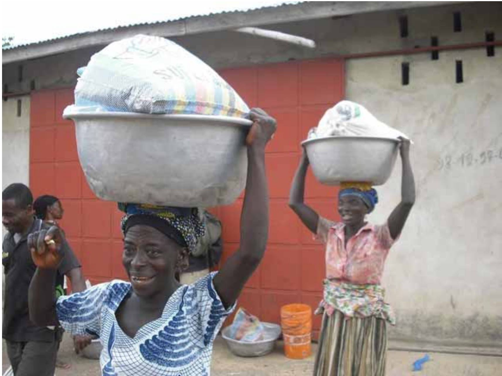
Stolz tragen die fleißigen Frauen ihren selbst erarbeiteten Lohn nach Hause