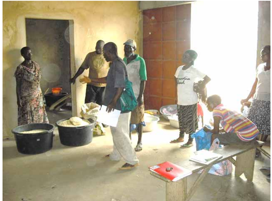
Die Verteilung wird vorbereitet