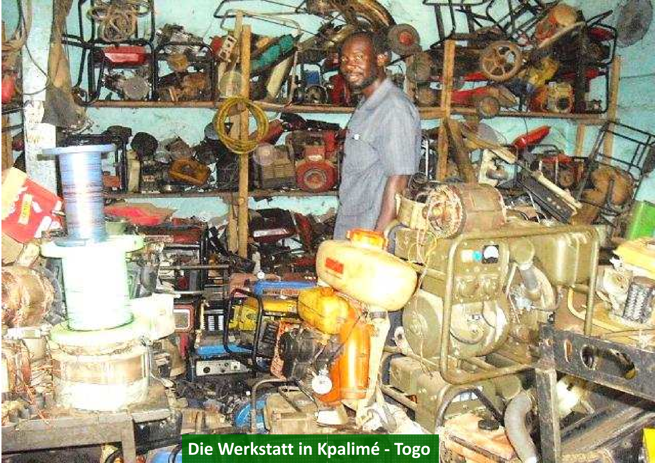
Die Werkstatt in Kpalimé - Togo